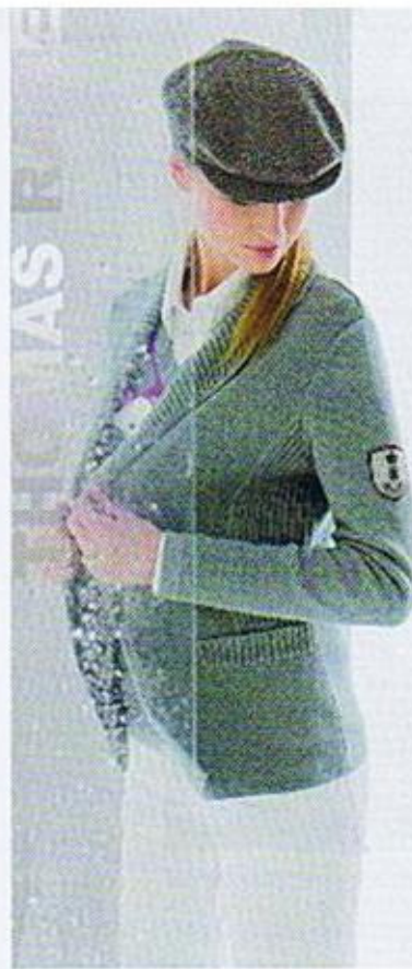
Countrystyle ist gefragt – in diesem Fall mit britischem Flair umgesetzt.

Weite mit neuem Antlitz. Dazu passen am besten schmale Unterteile. Sehr modern ist die Kombi aus lockerem, leicht geschopptem Ober- teil mit konischer Hose und Boyfriend-Blazer. Innovation kommt oft übers Material. Kontraste bringen die Kombis von Leder mit Wolle, Strick und Jersey mit Seide ins Spiel. Femenität fehlt durch feine Jerseys und Seide nicht und findet sich z.B. in DrapésHIRTS und -kleidern. Für den Bruch sorgen maskuline Stoffe zur Seidenbluse oder Chanel- jacke zur Boyfriend-Jeans. Für den Abend setzt Pelz als Jacke oder Weste luxuriöse Akzente.