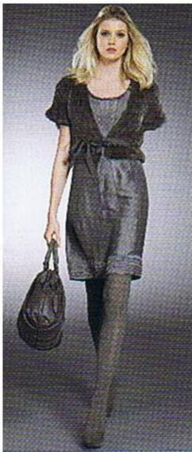
Der Mix macht's: So auch hier beim Felljäckchen zum seidigen Kleid.