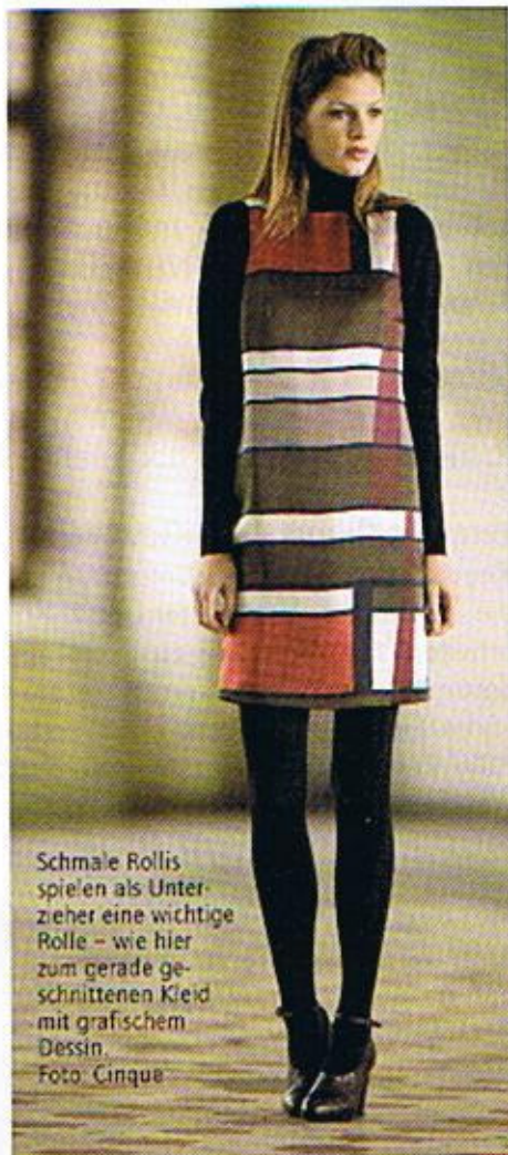
Schmale Rollis spielen als Unterzieher eine wichtige Rolle – wie hier zum gerade geschnittenen Kleid mit grafischem Dessin.

Ungewöhnlicher Materialmix trägt wesentlich zum gewollten Bruch bei. Wolle zeigt sich in großer Vielseitigkeit. Jerseys ersetzen Webware und imitieren Wolle. Sie treten als schwere Varianten, aber auch als Doubleface-Maschenstoffe, transparente Wolljerseys oder als fließende Qualitäten auf. Im Casualbereich finden sich Cord, Sportsamt, Denim und geschmirgelte Softcottons. Feminin wird's mit gewaschener Seide, Fantasiejacquards, Lurex, Glanz, Bro-