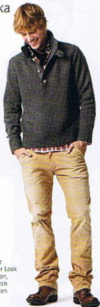
Ein ganz typischer Look der Saison, kreiert von Burlington.