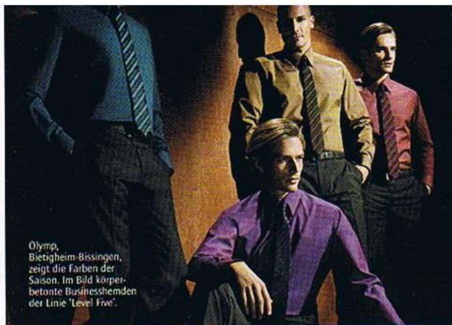
Olymp, Bietigheim-Bissingen, zeigt die Farben der Saison. Im Bild körperbetonte Businesshemden der Linie 'Level Five'.