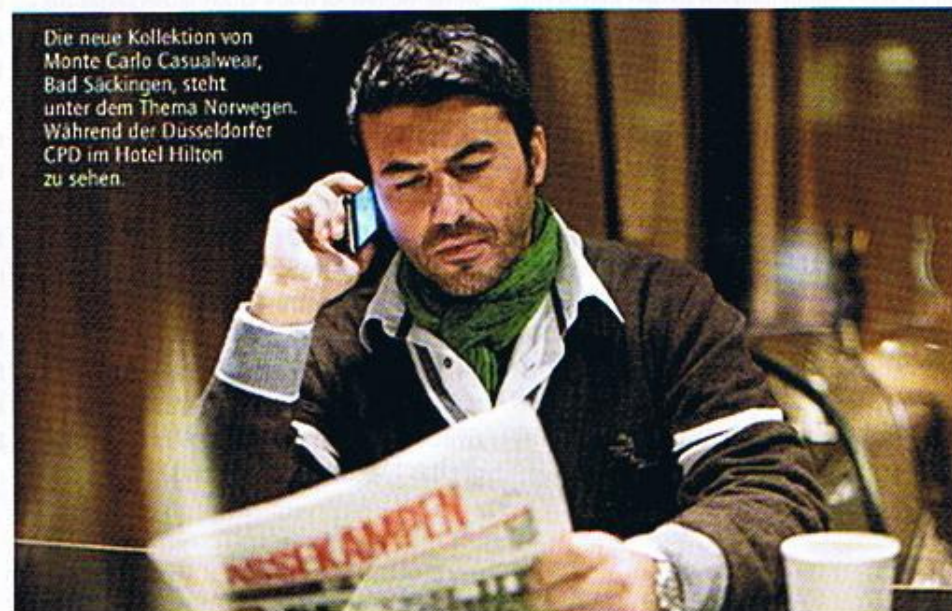
Die neue Kollektion von Monte Carlo Casualwear, Bad Säckingen, steht unter dem Thema Norwegen. Während der Düsseldorfer CPD im Hotel Hilton zu sehen.